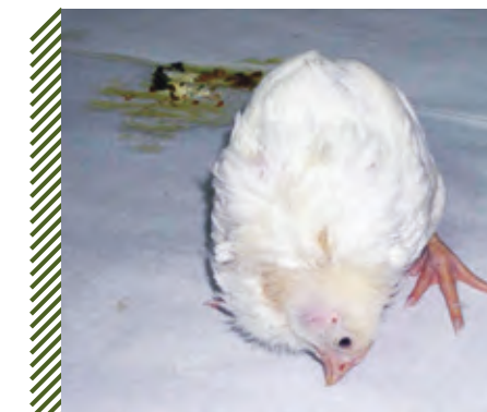
Искривление и заворот шеи, диарея