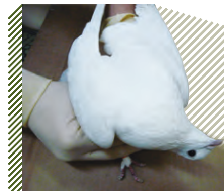
Искривление и заворот шеи, голубь