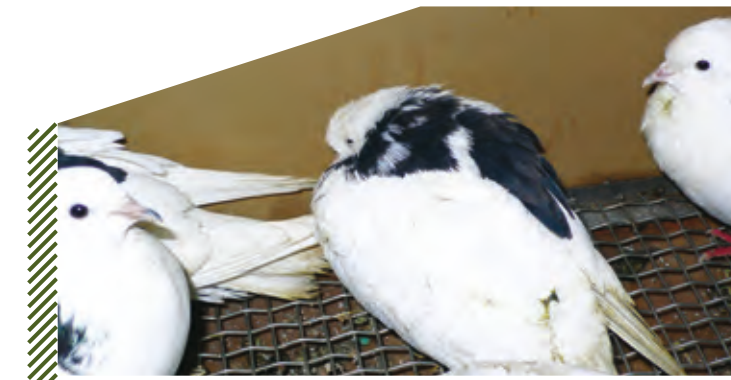
Угнетенное состояние, голубь

Инструкция о мероприятиях по борьбе с ньюкаслской болезнью (псевдочумой) птиц (утв. Главным управлением ветеринарии Министерства сельского хозяйства СССР 9 июня 1976г. с изменениями и дополнениями от 28 августа 1978г. взамен инструкции от 21 июля 1965г.)