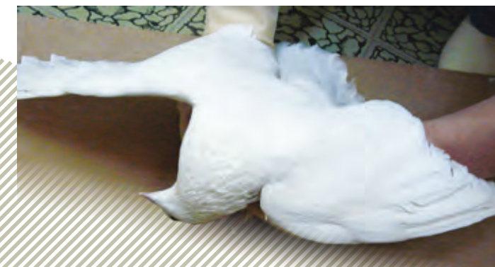
Искривление и заворот шеи, парез крыльев, голубь