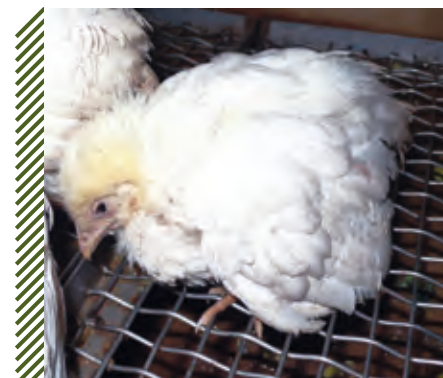
Гиподинамия, парез крыльев