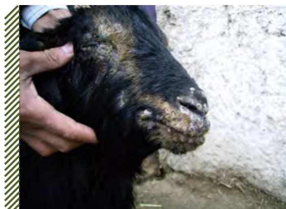
Выраженные папулы и назальный экссудат на морде козы

Приказ от 24 августа 2021 г. № 587 «Об утверждении ветеринарных правил осуществления профилактических, диагностических, ограничительных и иных мероприятий, установления и отмены карантина и иных ограничений, направленных на предотвращение распространения и ликвидацию очагов оспы овец и коз».