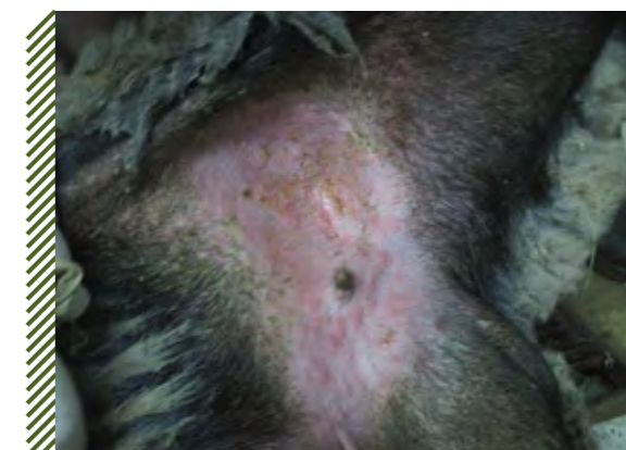
Гиперемия и вторичные папулы на бесшерстном участке кожи овцы