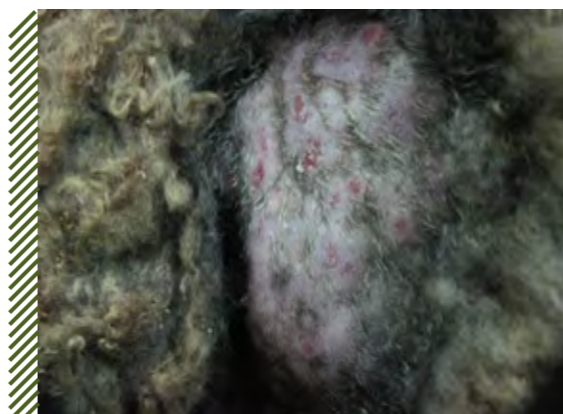
Поражения кожи на выбритом участке кожи при проведении работ по освежению вируса оспы штамм «Афганский»