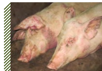
Биопроба на свиньях. Покраснение, кровоизлияния под кожей ушей, головы, подгрудка