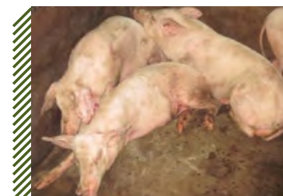
Биопроба на свиньях. Угнетение, скучивание, гибель животных