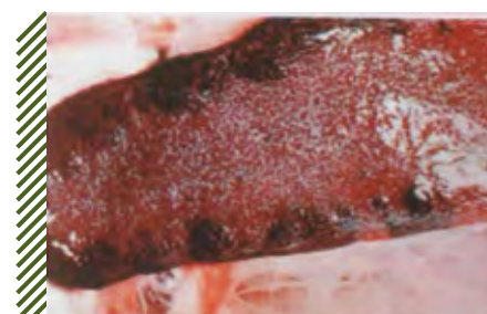
Краевые инфаркты на селезенке