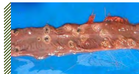
Очаги некроза в кишечнике