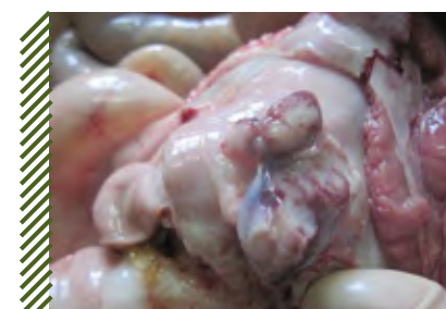
Гиперплазия и гиперемия лимфатического узла