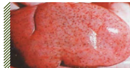
Множественные точечные кровоизлияния в корковом слое почек

При подостром и хроническом течении признаки серозно-фибринозного плеврита и перикардита. В кишечнике обнаруживают выраженные крупозно-дифтеритические и язвенно-некротические поражения.