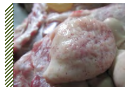
Множественные точечные кровоизлияния в слизистую оболочку мочевого пузыря