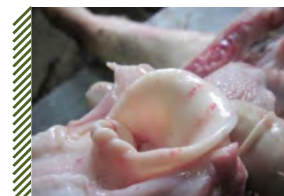
Точечные кровоизлияния на слизистой надгортанника